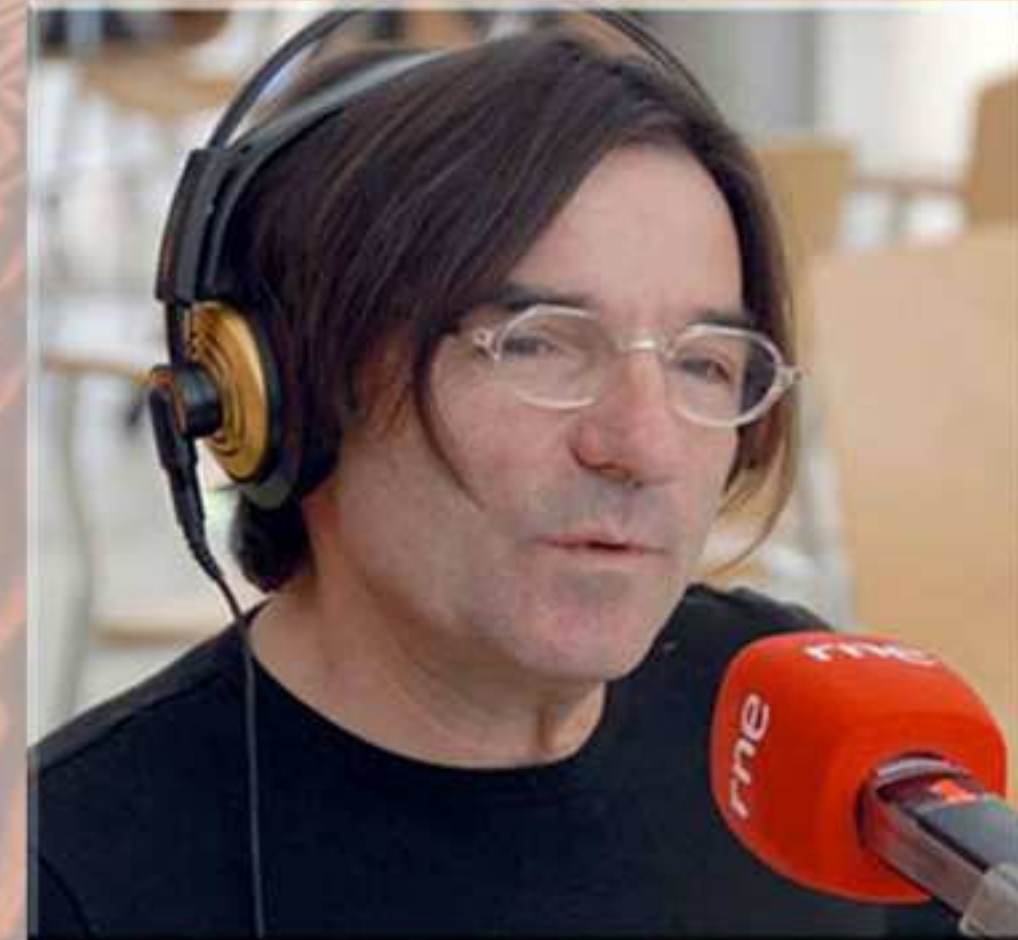
Javier Tolentino. El Séptimo Vicio RNE3